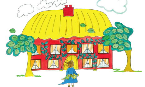
3 Bettina geht ins Haus.