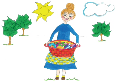
0 Heute ist Washtag.