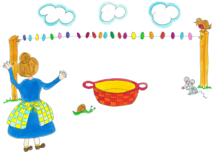
4 Wo sind die Kleider?