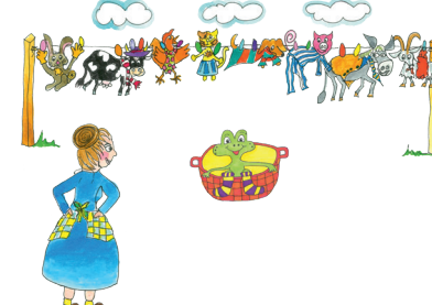
14 Die Tiere hängen an der Wäscheleine.