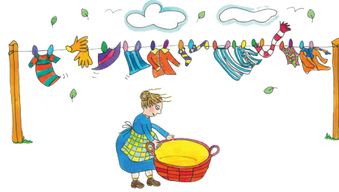
2 Plötzlich beginnt der Wind zu wehen.