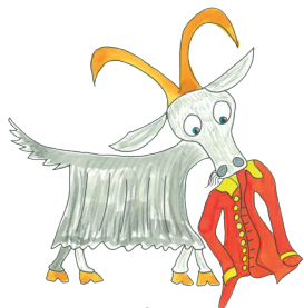
12 Die Ziege frisst das Hemd