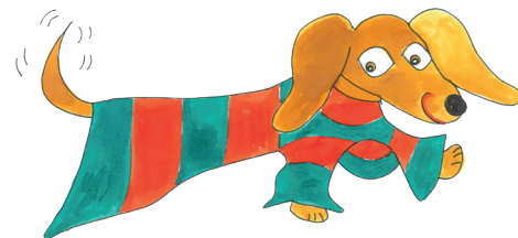
9 Der Hund hat das T-Shirt an.