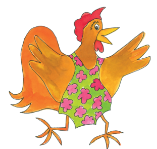
7 Die Henne hat den Badeanzug an.