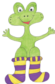
13 Der Frosch hat die Socken an.