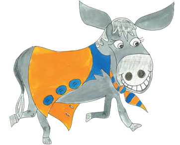
11 Der Esel hat die Jacke an.