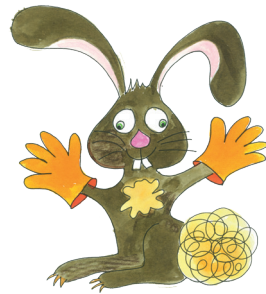
5 Der Hase hat die Handschuhe an.