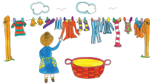
1 Bettina hängt die Wäsche auf.