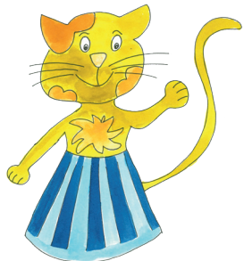
8 Die Katze hat den Rock an.