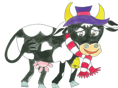
6 Die Kuh trägt den Hut.