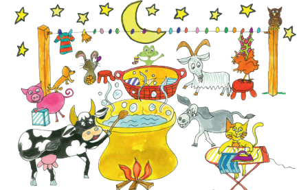
15 Die Tiere arbeiten fleißig.