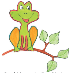
1 Quaki besucht Familie Lustig.