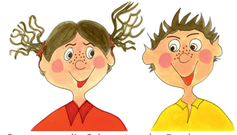
3 die Schwester, der Bruder