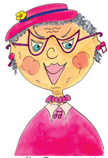
9 die Grossmutter