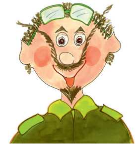
7 der Vater