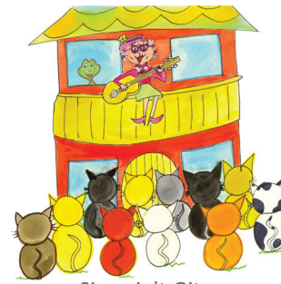
10 Sie spielt Gitarre.