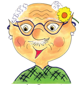
11 der Grossvater