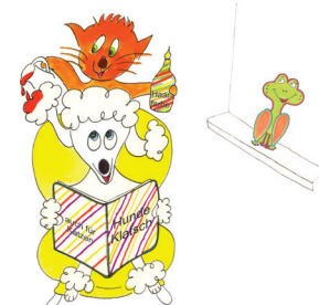
15 Hund Lupi ist beim Frisör.