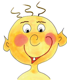
13 das Baby