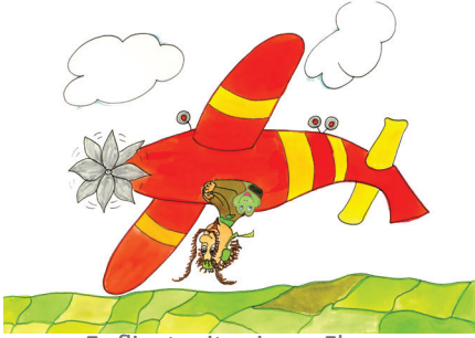
8 Er fliegt mit seinem Flugzeug.