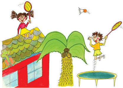
4 Sie spielen Federball.