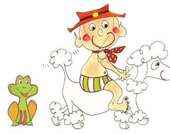
14 Lenny spielt Cowboy.