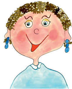
5 die Mutter