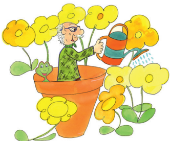
12 Er giesst die Blumen.