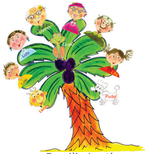
0 Familie Lustig