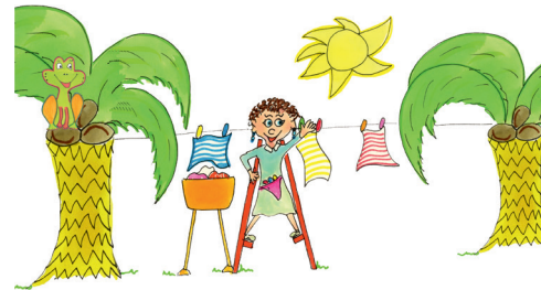
6 Sie hängt die Wäsche auf.