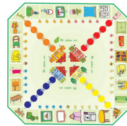
Das Haus Brettspiel